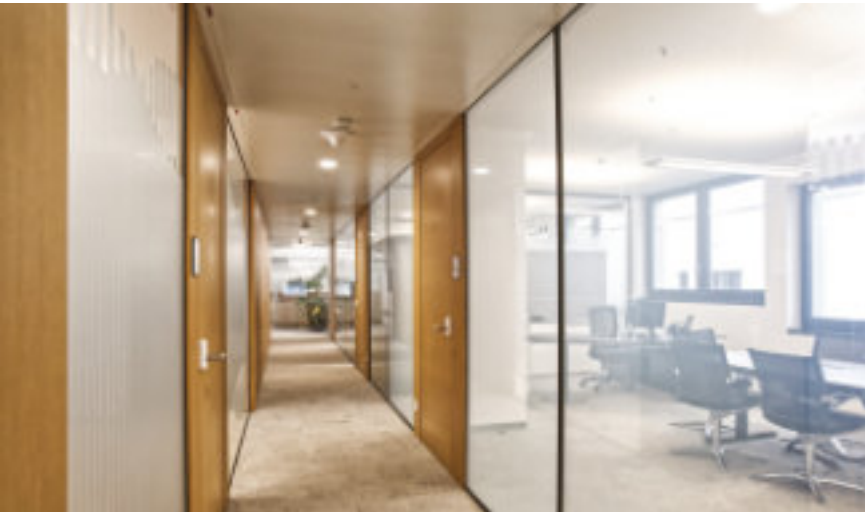
Lichtdurchflutete Büroetagen für ein besseres Arbeitsklima.