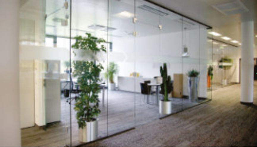
Besprechungsräume und Büros – offen und doch akustisch getrennt.