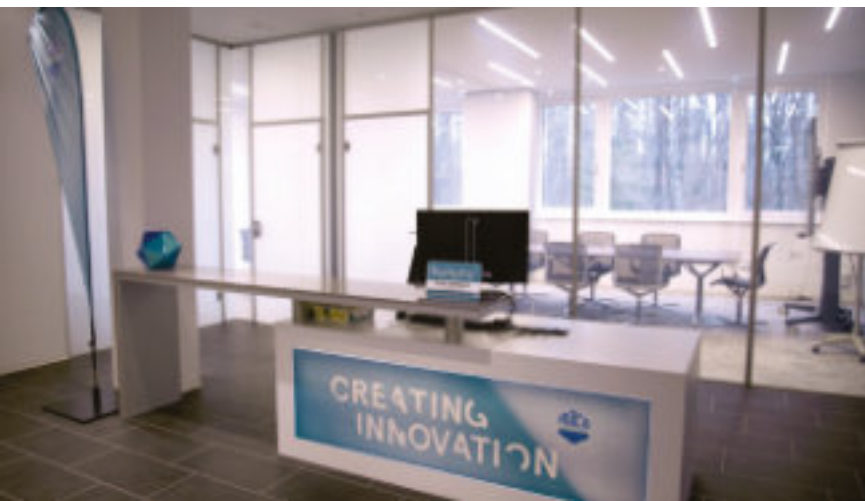
Durchsichtig oder blickdicht.