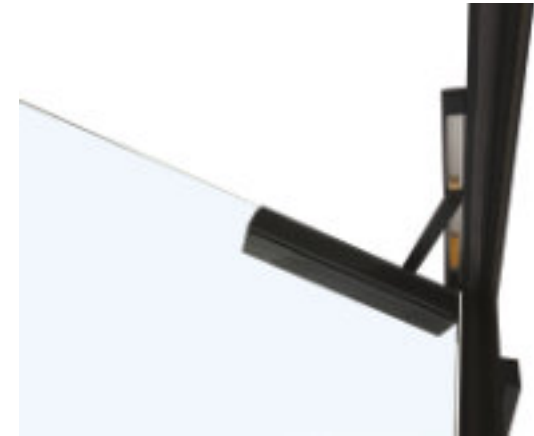
Kombinieren Sie weitere Komponenten, z. B. einen Türschließer.